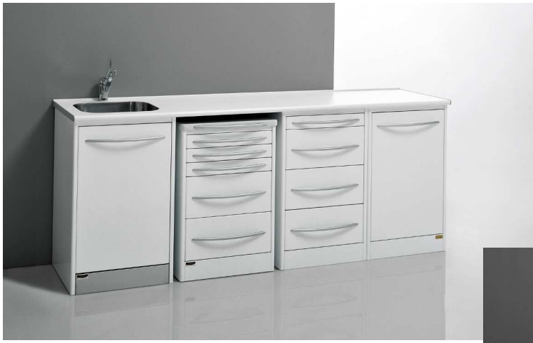
PRIMAVERA e PRIMAVERA C: L'essenziale e la semplicità a portata di mano.